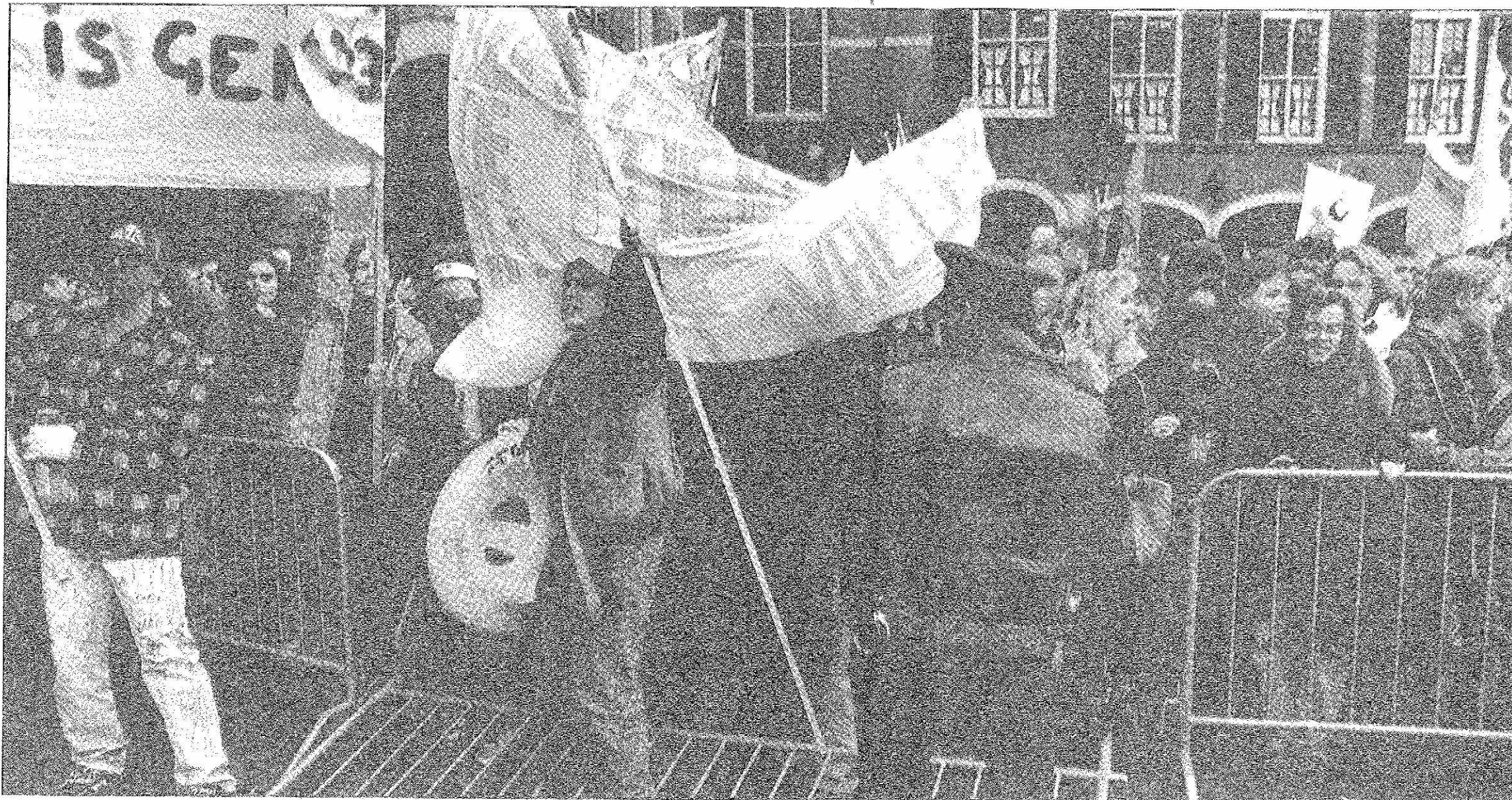
De matheid waarmee studenten de afgelopen maanden bezuinigingsmaatregelen over zich heen lieten komen, sloeg afgelopen dinsdag om in heftige protesten op Het Binnenhof.